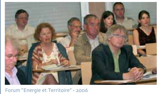
Forum "Energie et Territoire" - 2006

- Les premiers acteurs de l'éducation à l'environnement sont issus des mouvements de jeunesse et d'éducation populaire (scoutisme, tourisme social, domaine du plein air...), de l'enseignement agricole et du monde scolaire (activités d'éveil et classes transplantées) ; ensuite sont apparues les associations de protection et les Réserves Naturelles, les Parcs Nationaux et Régionaux, les Centres Permanents d'Initiative à l'Environnement