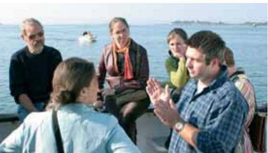
Inauguration des mouillages écologiques - 2005

Les 45 Parcs Naturels Régionaux répartis sur le territoire français jouent un rôle moteur en ce domaine, développant des programmes et des actions originales pour tous les publics. La pédagogie à l'environnement est l'une des missions fondatrices des Parcs depuis leur création en 1967. Aujourd'hui, elle inclut l'éducation à la biodiversité, aux milieux naturels, au patrimoine