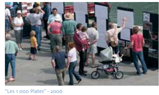
"Les 1 000 Plates" - 2006

(1) Colloque SFFERE, système de formation de formateur à l'Education realtive à l'Environnement.