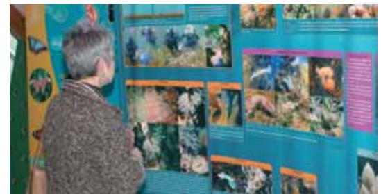
Exposition "20 000 Lieux sous le Golfe"

PAR et DANS l'environnement développe la relation directe avec les "choses et les gens" ; c'est un moteur essentiel à l'éveil de la sensibilité, condition primordiale pour la préservation. Enfin, l'éducation POUR l'environnement forme des citoyens éco-responsables, acteurs conscients des problèmes.