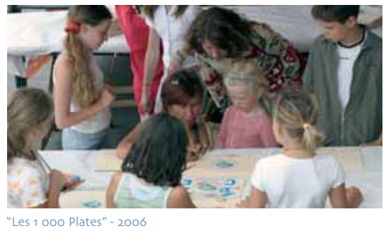
"Les 1 000 Plates" - 2006